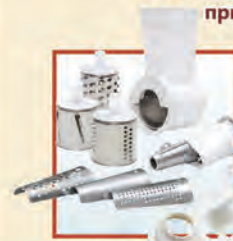
Электромясорубка «Аксион» М 31.02