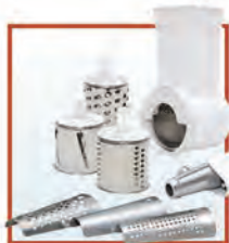
Электромясорубка "Бриз" М 11.02 Meat-mincer "BRIZ" М 21.02

Комплектуется приставкой-овощерезкой с тремя сменными барабанами и приставкой-соковыжималкой.