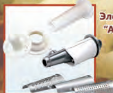
Электромясорубка "Аксион" М 32.04

Completed with an add-on vegetable-slicing machine with three removable drums. It is intended to slice products and for small-sized and large-sized shredding of vegetables, "kebbe" attachment and attachment for filling sausage products