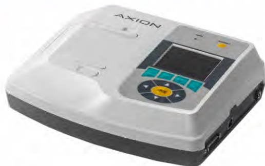
EK1T-1/3-07 «Axion» Single/three-Channel Electrocardiograph