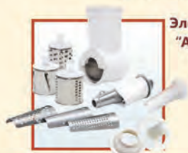
Электромясорубка "Аксион" М 32.02