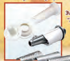
Электромясорубка «Аксион» М 31.04

Completed with an add-on vegetable-slicing machine with three removable drums. It is intended to slice products and for small-sized and large-sized shredding of vegetables, «kebbe» attachment and attachment for filling sausage products