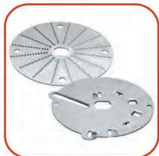
Диски для шинковки овощей и фруктов и нарезки ломтиками