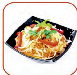
Discs for vegetable and fruit shredding and for slicing