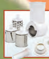
Электромясорубка «Аксион» М 12.03 Meat-mincer «AXION» M 12.03

Completed with an add-on vegetable-slicing machine with three removable drums and an add-on juice-squeezer, «kebbe» attachment and attachment for filling sausage products