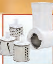
Электромясорубка "Бриз" М 11.03 Meat-mincer "BRIZ" М 11.03

Completed with an add-on vegetable-slicing machine with three removable drums and an add-on juice-squeezer.