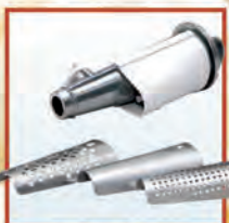
Электромясорубка "Бриз" М 11.04 Meat-mincer "BRIZ" М 11.04

Completed with an add-on vegetable-slicing machine with three removable drums. It is intended to slice products and for small-sized and large-sized shredding of vegetables.