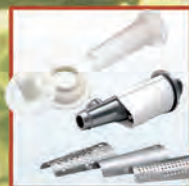
Электромясорубка «Аксион» М 12.04 Meat-mincer «AXION» M 12.04

Completed with an add-on vegetable-slicing machine with three removable drums. It is intended to slice products and for small-sized and large-sized shredding of vegetables, «kebbe» attachment and attachment for filling sausage products