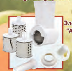
Электромясорубка "Аксион" М 32.03

Completed with an add-on vegetable-slicing machine with three removable drums and an add-on juice-squeezer, "kebbe" attachment and attachment for filling sausage products