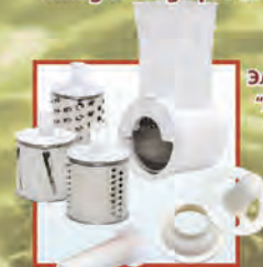
Электромясорубка «Аксион» М 31.03

Completed with an add-on vegetable-slicing machine with three removable drums and an add-on juice-squeezer, «kebbe» attachment and attachment for filling sausage products