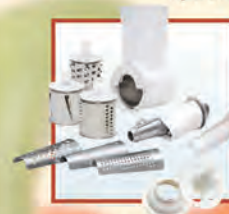
Электромясорубка «Аксион» М 12.02 Meat-mincer «AXION» M 12.02

Комплектуется приставкой-овощерезкой с тремя сменными барабанами и приставкой-соковыжималкой, приставкой «кеббе» и приставкой для набивки колбас.