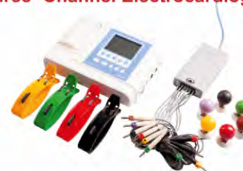
EK3TC-3/6-04 «Axion» Three -Channel Electrocardiograph