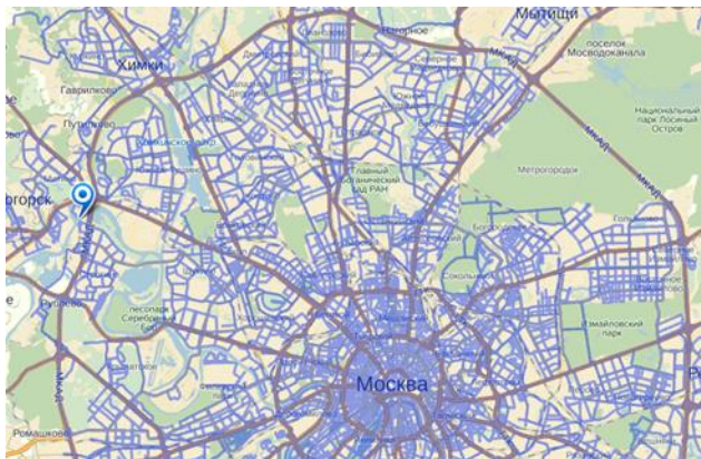
モスクワ・クロッカス国際展示場地図

Russia, 125124, Moscow, 3-ya ul. Yamskogo Polya, D. 14/16