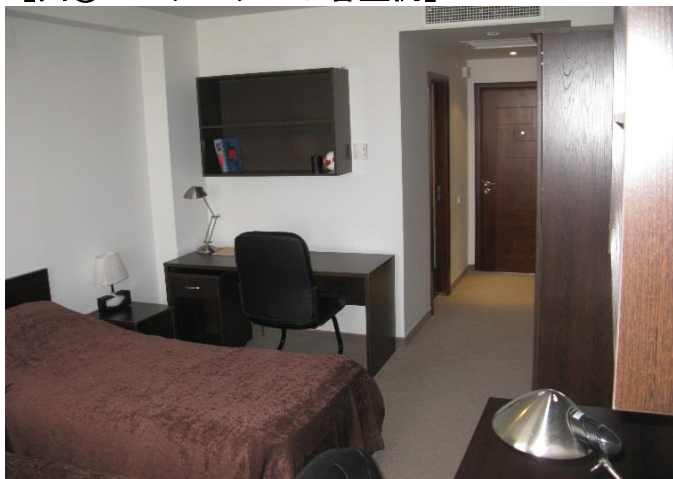
【図① スタンダード客室例】