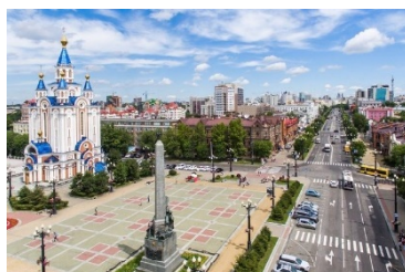
ハバロフスク市のメイン通り