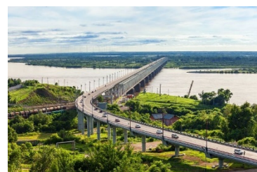
アムール川とアムール鉄橋